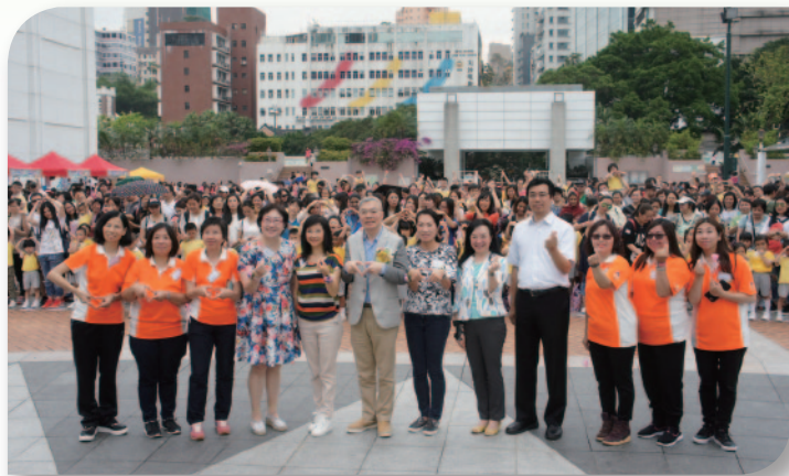
■ 嘉賓及校長們帶領現場的小朋友和家長一同獻上愛心。

樂善堂轄屬幼稚園於2017年5月13日假九龍公園舉行「愛與童行」親子嘉年華活動，是次活動獲本堂主席、幼稚園校監及校董到場支持，出席的小朋友及家長更多達1000人。嘉年華活動包括有小朋友的精彩表演、親子填色比賽頒獎禮及攤位遊戲等，場面非常熱鬧。嘉年華以「愛與童行」為主題，期望參與的家長和小朋友藉此活動體會到「愛」的重要性，關心小朋友的成長和需要，彼此溝通，互相了解，建立和睦融洽的親子關係。