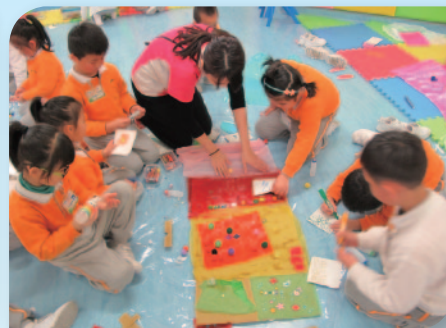
■ 繪本教學延伸活動。