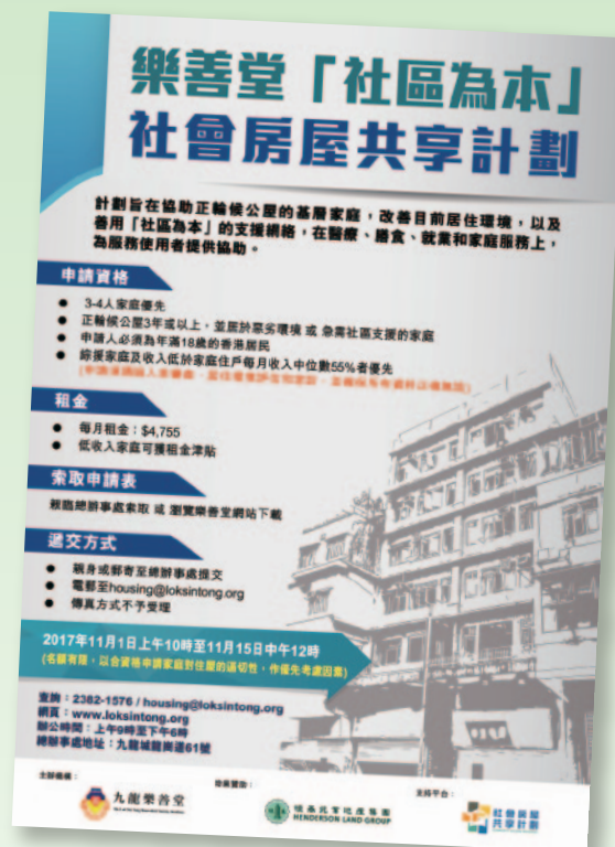
■ 樂善堂「社區為本」房屋共享計劃。

而本堂在推出計劃後，以問卷形式向入住社會房屋之家庭進行「社會房屋生活質素調查」，調查顯示100%家庭滿意整體居住環境，並有超過9成家庭同意其身心健康有改善，可見計劃成效顯著。