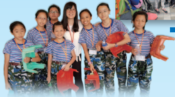
■ 領袖生體驗軍人刻苦、自律的生活。

2017年6月20至23日，20位領袖生到廣州參加「聯校精英領袖軍紀體驗營」，透過體驗軍人刻苦、自律的生活，培養出正面的價值觀，並明白到「一分耕耘，一分收穫」的道理。