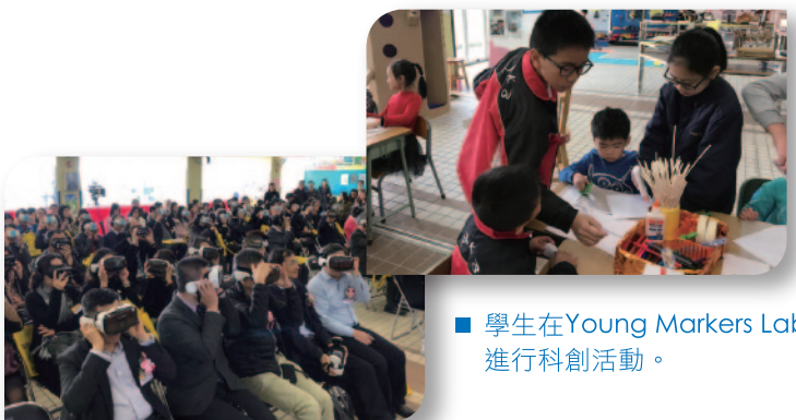
■ 學生在Young Makers Lab進行科創活動。