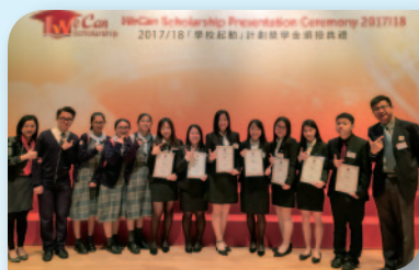
■ 2017中六畢業生於中學文憑試考獲佳績，獲「學校起動」計劃頒發「升讀大學獎學金」。

此外，為了讓具潛質的學生在文憑試中有更好表現，本校推行「摘星計劃」，挑選中六級數位尖子，與科任老師共同協定最佳的學習模式，包括以小組形式進行抽離式補課、利用通訊軟件開設群組以支援學生學習等。經過師生的共同努力，該批學生在應屆文憑試中創下佳績，成為名副其實的摘星尖子，順利升讀本地大學學位課程，更全數獲九龍倉「學校起動」計劃頒發「升讀大學獎學金」。