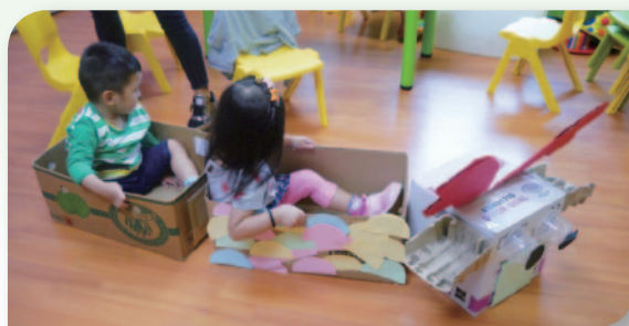
■ 小朋友進行體驗活動，學習社交和言語交流。

過去一年，於本中心接受治療/訓練的總共有138人，當中超過85%人士表示言語能力/認知/社交/自理等方面有所改善。本中心會繼續提供優質而全面服務，以強化兒童整體發展。