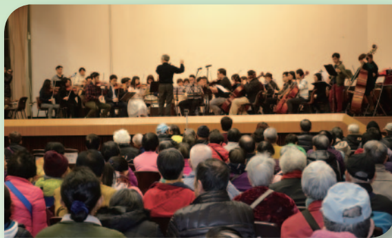
■ 台上台下融為一體。