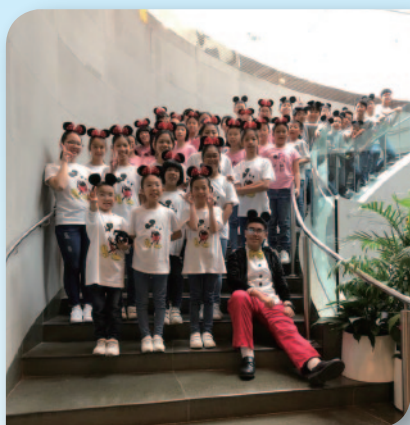
■ 九龍城區學校音樂匯演，手鐘隊和合唱團的學生在老師的訓練下有出色表現。

樂校老師本著「所有孩子都是可貴、可教和可培育發展」的信念，靈活實施體藝教育、戲劇教育，致力為學生創設多元學習經歷，以緊絀的人力資源，不遺餘力發展學生學業以外的不同潛能，在語文、科技、體藝、音樂以及戲劇等項目中爭取多項佳績。學生在校園電視台的老師帶領下，參與由香港中文大學舉辦的「綠色微電影2017小學組比賽」獲取冠軍和最佳劇情獎；也在由香港電台舉辦慶祝香港特區回歸祖國20年的「凝視香港30秒」短片比賽中勇奪冠軍；此外，在香港理工大學主辦的創客博覽會「Maker Faire Hong Kong X 造大世界 - Let's build something really big」計劃中，老師更刻意挑選有特殊學習需要的學生代表學校參賽，鼓勵他們以心中的夢與理想職業為主題，運用3D打印筆創作大型肖像，讓他們在過程中找回自我，燃起他們追求夢想的決心。學生於過程中表現出色，積極嘗試學習新的媒介創作，展示藝術及演說的能力，最後勇奪初級組一「評審創意大大獎Most Creative Big Thing」；老師們揮灑的汗水，灌溉出累累碩果。