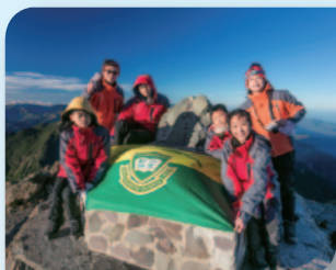
■ 余中師生成功登上台灣最高的玉山頂峰。