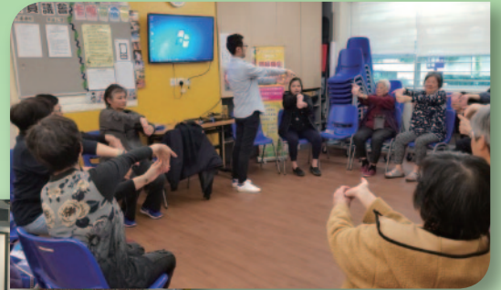
■ 物理治療師指導長者進行一些拉筋運動。