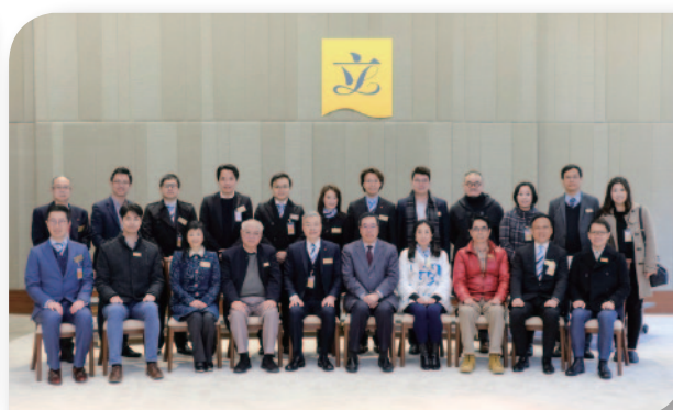
■ 立法會議員周年茶聚，本堂總理與立法會主席梁君彥GBS太平紳士(前排左六)及一眾議員拍照留念。