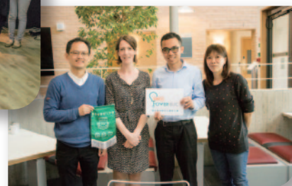
■ 訪問英國劍橋大學教育學系。