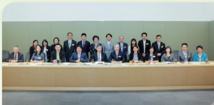
■ 本堂總理與勞工及福利局局長羅致光博士,GBS,太平紳士(前排左五)、社會福利署署長葉文娟太平紳士(前排左七)及其他長官彼此交流。