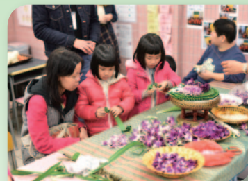
■ 家長及孩子用心製作泰國傳統 水燈。