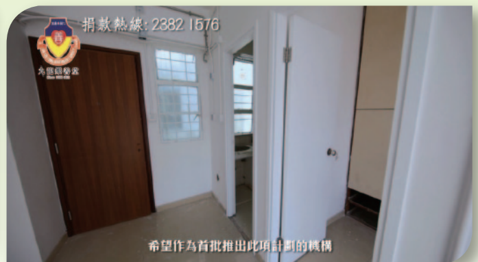
■ 宣傳片中介紹樂善堂「社區為本」社會房屋計劃。