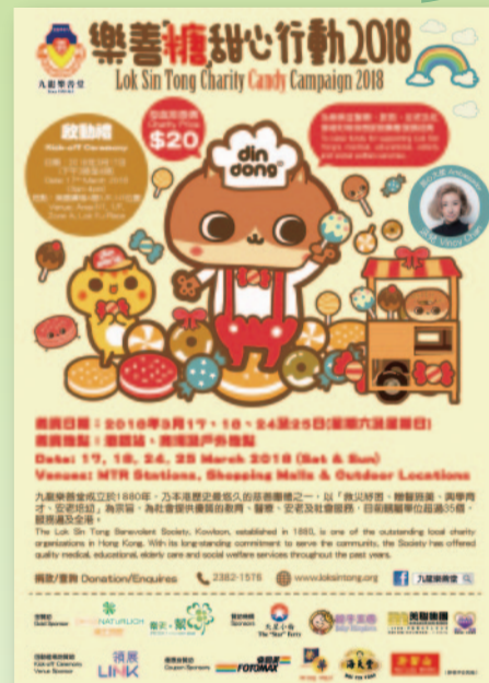
■ 樂善「糖」甜心行動2018宣傳海報。

樂善堂總動員支持及參與，各單位派出多個義工隊到全港多個銷售點進行義賣；而多個外界團隊亦參與其中，向市民大眾勸銷，讓樂善堂善業得以持續發展，惠澤社群。