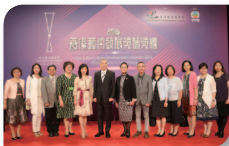
■ 本校榮獲由香港藝術發展局頒發的「2016藝術教育獎」。