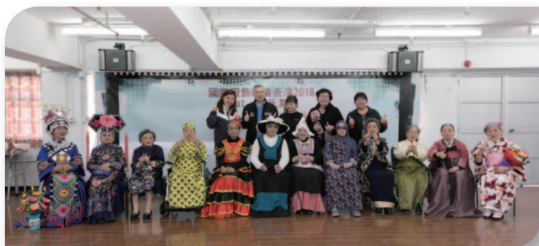
■ 院友與主席及總理合照。

當天12位女院友分別穿上中國、瑤族、荷蘭、印度、韓國、日本、西班牙、泰國、土耳其、西非及德國的民族服飾在台上行“catwalk”，令人眼前一亮；他們維肖維妙的演出，怎不叫人豎起大姆指俾個“讚”！