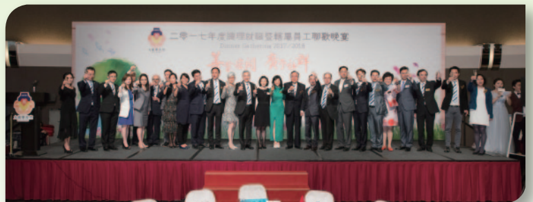
■ 一眾嘉賓與台下逾千名樂善堂同工一同高舉酒杯，祝願樂善堂繼續開來，造福更多市民。

本堂於2017年5月23日假九龍灣國際展貿中心舉行「2017年度總理就職暨轄屬員工聯歡晚宴」，近千名轄屬單位員工與應屆常務總理聚首一堂，筵開百席，共渡一個歡愉的晚上。