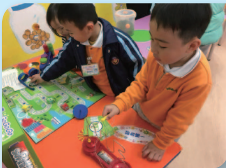
■ 科學實驗活動 — 《一觸即發》。