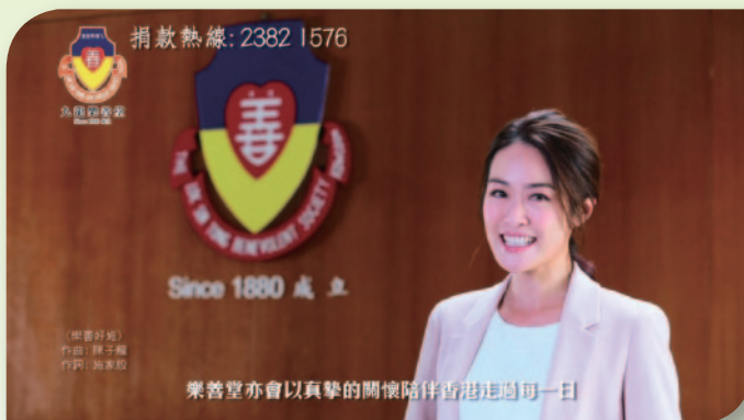
■ 本堂拍攝新一輯「樂善同行顯情真」宣傳片。