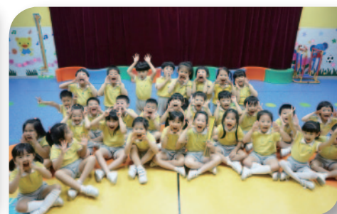
■ 與幼兒分享獲獎的喜悅。