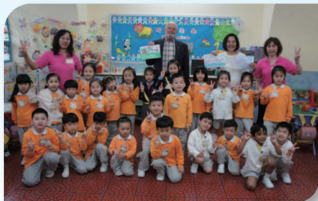
■ 英語活動：「Happy gathering with guests」。

樂善堂梁泳釗幼稚園致力培養富有學識、身心健康的新一代，學校重視兒童的多元發展，運用豐富資源推行德育課程和活動，以校訓「仁、愛、勤、誠」為出發點，配合美國「啟發潛能教育」理論，透過5P的概念(即人物、地方、政策、計劃及過程)，全面提升教育質素，為兒童締造一個積極和關懷的學習環境，再配合「情智教育 Kimochis」理念為基礎，培養兒童內在素質，發揮每一位兒童的情緒智商。