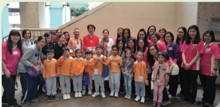
■ 總理們到各銷售點為義工們打氣。