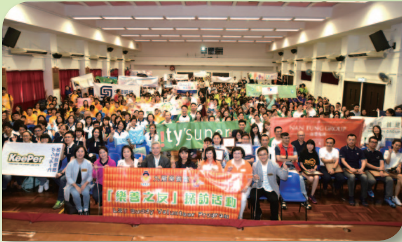
■ 樂善之友義工活動凝聚各界義工，將關愛帶到社區。

樂善堂已持續多年舉辦社區探訪活動，不論活動規模及義工人數已屢創新高，受惠人數眾多。不少義工亦已支持本堂多年，每次活動均鼎力支持，身體力行支持有意義的活動。全賴各界義工、善長及機構支持，義工活動才得以順利舉行。本堂期望可繼續凝聚各界支持，實踐「關懷情真·樂善同行」的精神。