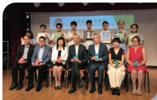
■ 本校榮獲環境局黃錦星局長，在中西區區議會主席葉永城及中西區民政事務處民政事務專員黃何詠詩女士陪同下，於2017年10月4日光臨指導。九龍樂善堂郭予宏主席、校監楊小玲博士撥冗支持並帶領本校師生和家長熱烈歡迎一眾嘉賓。