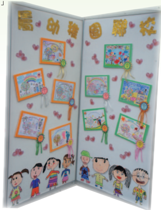
■ 聯校填色及創作比賽的得獎作品。