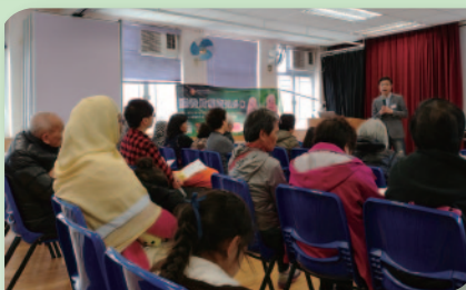
■ 法律顧問於諮詢講座中講解贍養費之 法例及求助方法。

本中心將會與香港公共圖書館合作，於九龍區不同的圖書館舉辦多元文化交流活動，當中包括：《文化薈萃親子工作坊》，教授家長及孩子一同製作傳統手藝，例如特色花環、別緻手繪、民族服飾體驗、品嚐傳統小食等等；同時推出《認識香港少數族裔系列》分享會，帶領少數族裔人士與參加者進行交流活動，讓大眾認識泰國、巴基斯坦等少數族裔在香港的生活點滴；另一系列的活動是舉行《多元文化薈萃工作坊》，當中包括不同少數族裔傳統手藝製作，希望透過不同的體驗式活動，讓香港大眾市民更認識本土少數族裔在港的情況及其傳統文化，達致社區共融、互助互愛。