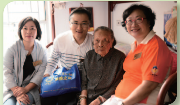
■ 樂善堂總理們亦身體力行，一同上門探訪長者。