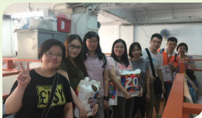
■ 義工們帶同福袋到私營安老院舍探望長者。

除與社區長者分享回歸箇中喜悅，在社署九龍城及油尖旺區福利辦事處聯繫下，樂善堂亦邀請義工到九龍城區內私營安老院舍進行探訪及送上禮物包，關心院內長者。長者對於義工到訪十分雀躍，與義工們無所不談，一同渡過愉快的下午。