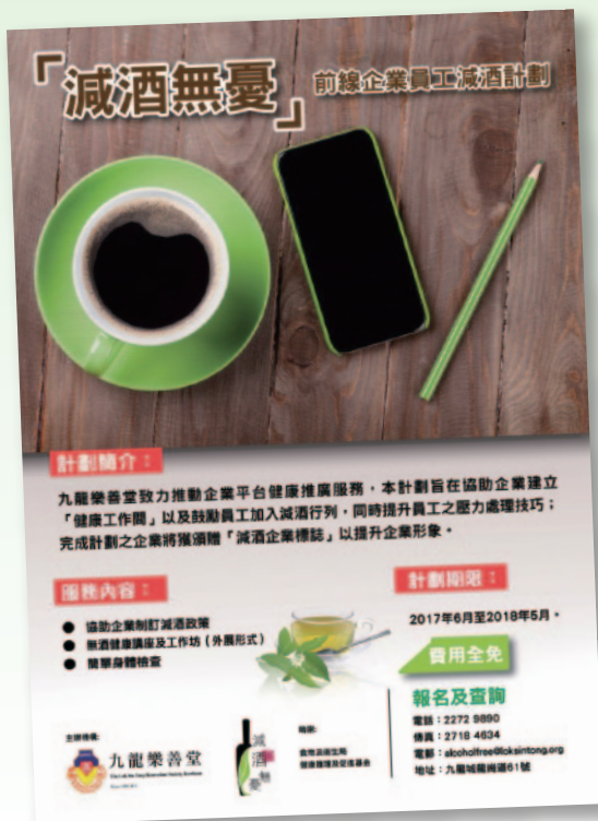
■ 「減酒無憂」前線企業員工減酒計劃。