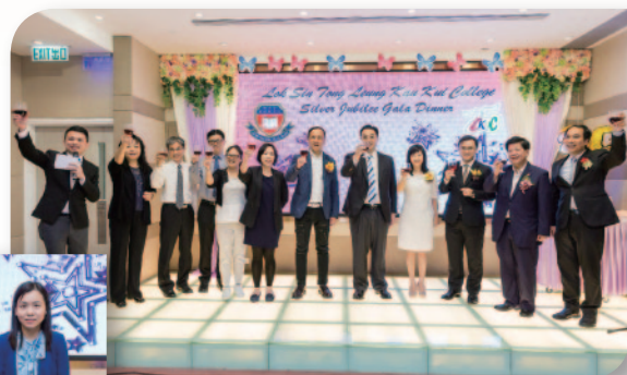
■ 銀禧校慶晚宴祝酒儀式。