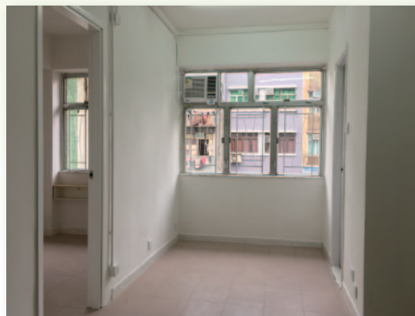
■ 單位內部裝修以簡約和環保為原則，保留原有間隔，再作翻新。