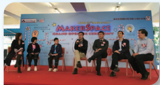
■ 多位學者與本校學生進行對談會。

上述各項活動有助學生更深入瞭解各地文化，並為他們提供塑造良好品格的機會，各人均獲益甚豐。