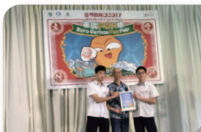
■ 港鐵「綠色生活自拍比賽校際比賽」冠軍。