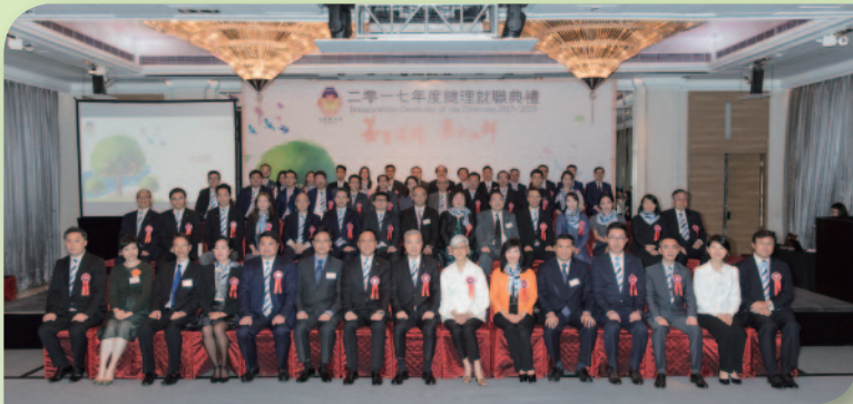
■ 樂善堂各常務總理、永遠顧問及當年委員於2017年度總理就職典禮上合照留念。

九龍樂善堂於2017年5月15日假 The Mira Hong Kong 舉行就職典禮，多個政府官員、社會賢達、各界嘉賓見證新一屆常務總理宣誓及就職，並由主禮嘉賓民政事務局局长劉江華太平紳士監誓及頒發選任書，意味著各常務總理將群策群力，帶領及策劃樂善堂的未來發展，使樂善堂的善業發展能更進一步。