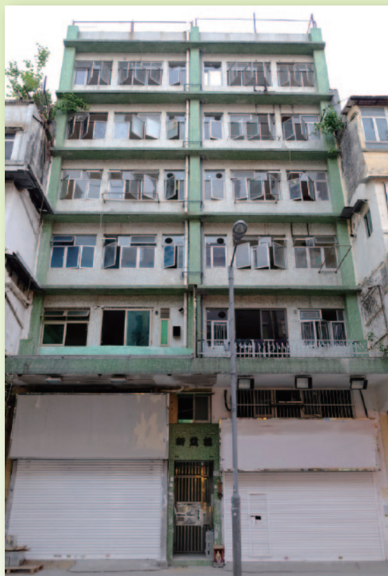
■ 本堂獲恒基善心支持，以象徵式$1租金租出位於九龍城福佬村道一棟20個單位的唐樓連地舖，作社會房屋的用途。

計劃以「社區為本」作服務宗旨，除了運用本堂在九龍城區內原有的資源優勢，如廉價及優質的西醫、牙醫及中醫服務、區內的教育支援、食物援助、少數族裔及家庭支援服務等，亦運用大廈兩個地舖，建立「共享服務空間」及「共享工作空間」。服務方面，包括社區飯堂、二手傢電店、課後託管服務等；共享工作方面，包括售賣復康用品之社企、花藝店和婦女培訓中心，以提供社會服務支援和原區工作機會及培訓。