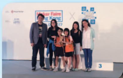
■ 弱勢孩子也可以懷抱大夢想，捧走評審創意大大獎。