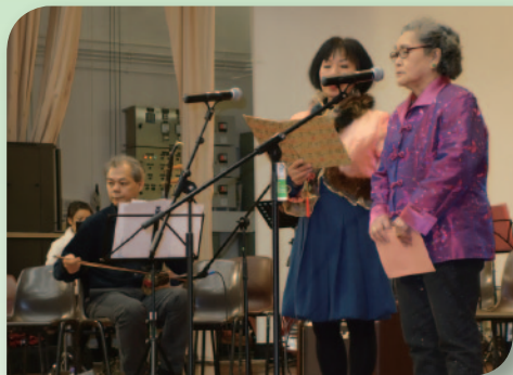
■ 院友伙拍義工演出粵曲環節。

今次音樂會有一個意義深長的使命，就是為本年5月13日的「管弦交響。妙韻非凡」慈善音樂會作綵排預演。慈善音樂會目的是為本院籌建小型音樂廳及廣播系統，將假荃灣大會堂演奏廳舉行，屆時演出的陣容更龐大，參演者還包括演藝人士、青少年樂團及樂善堂張葉茂清幼稚園的小朋友，所不變的就是台上台下與音樂一起玩這個特色。