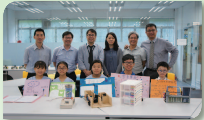
■ 樂善堂余近卿中學參與STEM產品設計的一眾師生。

科技發展日新月異，為緊貼時代的步伐，本堂多所學校亦發展STEM(科學、科技、工程和數學)，豐富同學學習領域。當中轄屬梁銶琚學校(分校)及余近卿中學一向在推動STEM學習有出色及卓越的表現，更獲教育局於2017/18學年指定為「專業發展學校」，與其他學校分享經驗；另外，余近卿中學更獲華南師範大學成立之「粵港澳促進STEM教育聯盟」獲邀成為全港首所「STEM教育實驗學校」，期望整合及分析相關的經驗，以探討在不同學校推行STEM教育的可行性及為其作示例，積極推動粵港澳教育界STEM的發展。