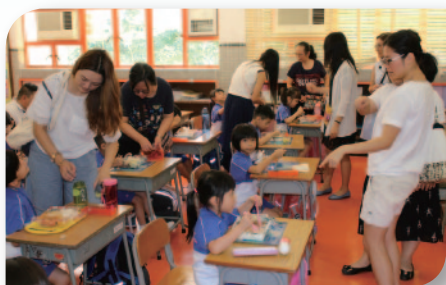
■ 小一新生家長到校觀察子女進膳情況。

近年，我們着意開放校園，鼓勵家長到校參與每天的學生早會，了解學校運作及學生生活情況。開放家長資源室，讓家長樂聚一起，交流育兒心得及建立友誼。利用資訊科技之便，建立家長校長Whatsapps群組，促進家校意見交流及訊息傳播；並鼓勵家長建立同級／同班Whatsapps互助群組，發揮互助精神及交流資訊。學校亦開放課堂，讓家長到校觀課，了解本校課程發展，教學安排，子女學習情況及交流意見。成立家長學堂，定期舉辦多元化講座，提昇家長育兒技巧及協助家長了解不同學習階段的事務。