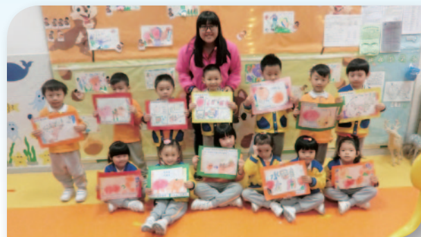
■ 大家共同合作創作故事。

本校榮獲由香港藝術發展局頒發的「2016年香港藝術教育獎（學校組）」，將品德教育與藝術課程融合，並以「仁、愛、勤、誠」為主題，利用繪本創作相關及延伸的教學活動，提昇幼兒的創意、多元智能及實踐品德價值教育。透過一系列的活動，幼兒從中學會自學、探索、創新和應變，並發展為全面而具個性的幼兒。此外，幼兒亦從日常生活中運用五官五感探索身邊藝術的素材，將藝術實踐於生活中，而幼兒的創作力和想像力，不單能透過生活經驗引發充滿童趣與創意的意念，更可以表達對生命的熱愛，散發出正能量。