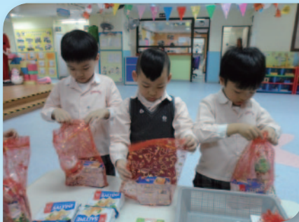
■ 學生為長者預備禮物。

「顧幼」持守啟發潛能教育理念，培育學生的「關愛」價值觀和態度，並有系統地規劃成長課程，按其能力和需要安排各類型關愛活動和服務；教師在日常課堂中會透過故事分享，角色扮演等進行品德教育，培養學生尊敬父母，關懷長者，愛護幼小等等的關愛態度。學校亦會帶動學生走出校園，實踐關愛文化，將關愛共融的態度推展社群鄰里。我們藉著聖誕節的來臨，安排學生前往探訪竹園南邨的樂善堂梁銻琚敬老之家，事前由九十多名學生細心準備禮物，又繪畫大型聖誕卡，齊齊為院內公公婆婆準備表演節目。探訪當日由全日高班二十位學生前往探訪，他們透過歌唱表演、遊戲與院內長者一同歡聚，學習愛惜家人外，也要學習尊敬和關愛長輩。品德教育需要「學習和實踐」，學生透過身體力行，方能內化成為習慣，從生活中實踐「關愛」。