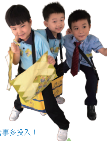
■ 售旗三劍俠，看孩子們為做善事多投入！