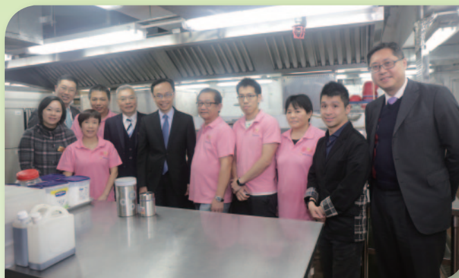
■ 聶德權局長與中心職員合照。