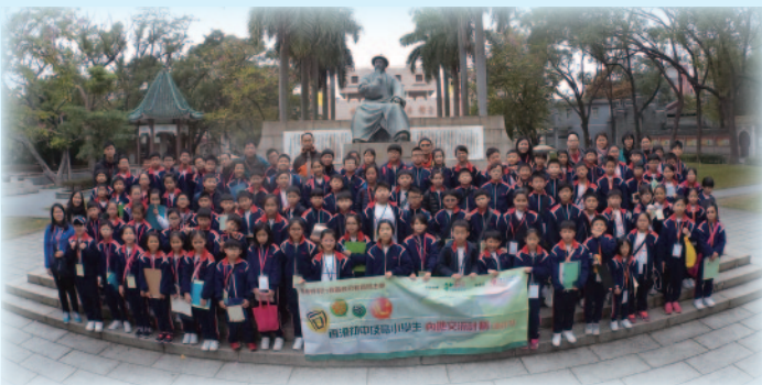
■ 師生在孫文紀念公園留影。

2017年4月1至6日，20位小四至小六學生參加了「台灣電波少年流浪記」，足跡遍及香港、台北、宜蘭和花蓮，各人透過與組員深入溝通，完成旅程中各項任務，並培養出責任感和承擔精神。