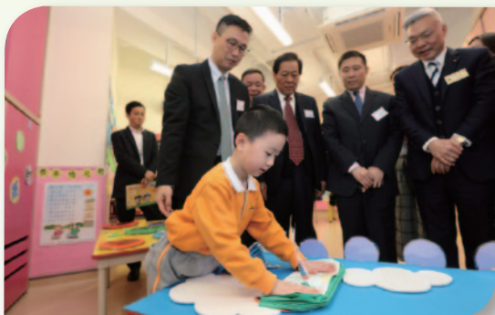
■ 學生充當小老師，向嘉賓示範科學小實驗。