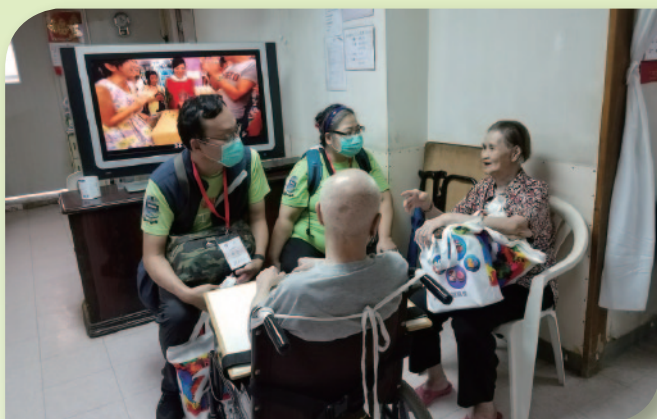
■ 除送上福袋外，義工們亦與老友記聊天，了解他們的需要。

首次家訪活動更已於2017年6月3日於新亞中學舉行，本堂更聯同九龍城民政事務處和教育局官員及超過500名企業義工一同到樂民新邨、土瓜灣等探訪長者，送上回歸福袋，關愛長者。