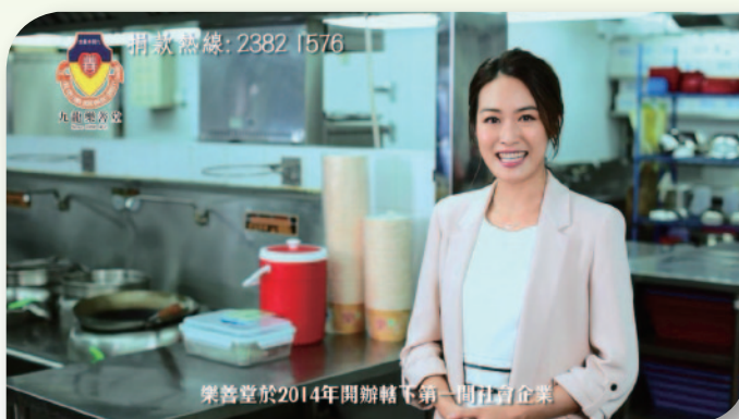
■ 「樂善同行顯情真」社會企業服務片段。