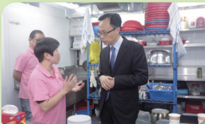
■ 聶德權局長聆聽廚師講解製作營養膳食過程。

政制及內地事務局局長聶德權太平紳士到訪樂「膳」堂營養膳食服務中心，了解中心為區內有需要人士製作營養膳食過程和服務，並與中心廚師分享交流。