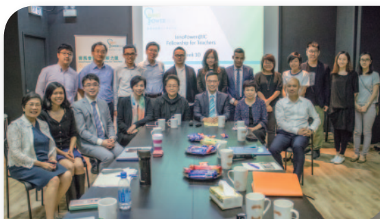
■ 各參與學校向教育局楊潤雄局長匯報創新計劃。