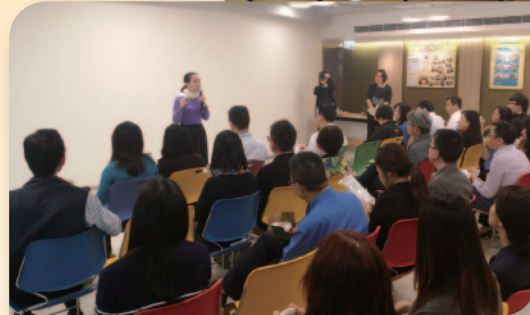
■ 外展健康教育計劃。