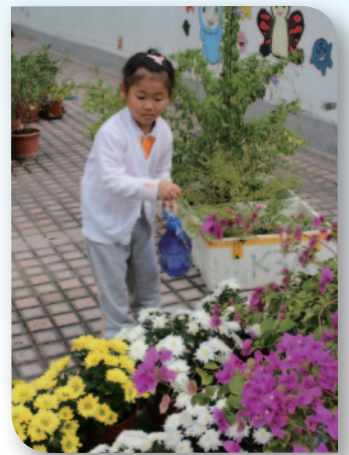
■ 因為愛 才會珍惜。

本校秉承「從遊戲中學習」的理念，透過視覺、嗅覺、觸覺等感官來欣賞世界。回顧過去多年，幼兒都全程投入在各項栽種活動中。我們今年嘗試以新的景象，來提升幼兒對種植的興趣及明白到照顧植物的責任，讓幼兒可以同心協力一齊動手，做個盡責的小園丁。除了增添不同的植物外，我們在整體佈置上亦花了不少心思。首先是將原為靠牆的植物遷移到中間位置，亦將植物有系統地分佈在不同區域內。老師在他們身邊一直幫著幼兒細心的翻土和澆水，每一個過程都鼓勵幼兒親自動手，讓幼兒充分運用各種感官學習。而各區之間亦以塑膠草地作連接，草面上擺放了多條膠條，使幼兒可赤腳在膠條上走路，讓他們在欣賞植物之餘，亦能促進自身各種感官的發展；此外，我們亦將家長與幼兒合作設計的藝術作品貼在圍欄上，讓幼兒可從中欣賞。我們亦擺上一個小水池，使幼兒認識到水耕種植。