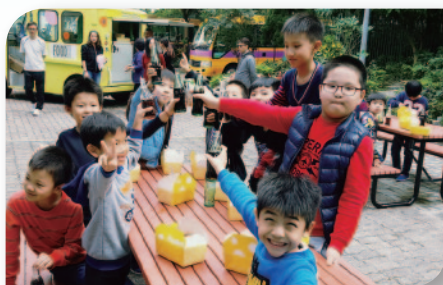
■ 聖誕聯歡日家長贊助全校師生美食車美食。