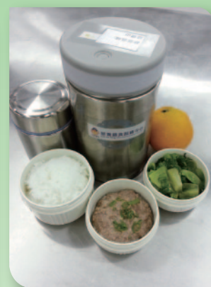
■ 為有需要人士提供營養飯餐。