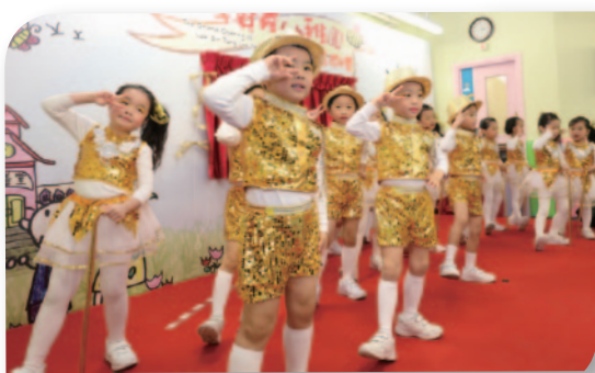
■ 學生精彩的舞蹈表演，令典禮生色不少。

樂善堂李賢義幼稚園強調以「兒童為本」，依循兒童身心發展規律，按「德、智、體、群、美」五育為綱領，加入更多體驗式學習和生活化訓練，協助兒童建立基本學習能力和自信，開發探索和解難的能力，同時亦開展STEM 教育的啟蒙課程，為兒童日後進入下一階段學習早作準備。