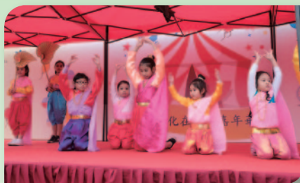
■ 泰國舞蹈班學員於「多元文化在龍城 嘉年華」展現學習成果。