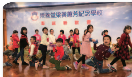
■ 聖誕聯歡會小二的自創舞蹈。