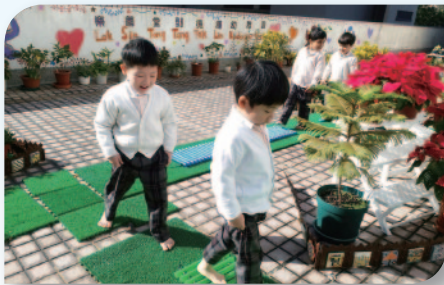
■ 親身體驗赤腳走路的樂趣。

學前階段是建立幼兒價值觀的重要時刻，幼兒從不同的學習範疇，透過親身的體驗，一點一滴的把知識累積起來。而更重要的是透過綠化相關的訊息，向幼兒灌輸生命的重要性，使他們從小便懂得愛護地球，珍惜生命，及培養保護環境的良好品德。