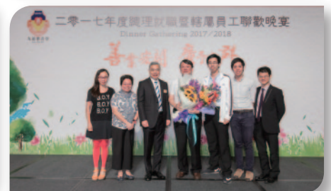
■ 晚宴亦同時頒發多個退休獎章，感激各同工多年來對樂善堂的付出及貢獻。