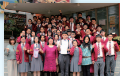
■ 第69屆香港學校朗誦節 高中英詩冠軍。