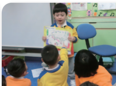
■ 幼兒有信心於在人前分享自己的想法。