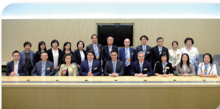
■ 本堂總理及學校主管拜訪教育局，與教育局局長楊潤雄太平紳士(前排左五)進行會面及互相分享。