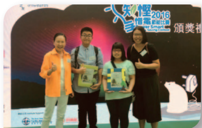
■ 「知慳惜電」節能比賽「勁減百分比大獎」及「勁減用量大獎」季軍。

本校致力推動環保，除由不同持份者合力制訂環保政策外，本校鼓勵全體師生要「三帶」：帶水樽、手巾及紙巾，身體力行地實踐環保生活。在學校推動下，師生聯誼活動皆鼓勵自備食具，減少使用即棄餐具，而師生也會按量準備食物，避免浪費。本校也致力節約用電，本校已連續18個月比去年減少用電量47068度。同時，本校在課堂內外也積極推廣環保訊息，例如透過不同科目滲入環境教育；又舉辦「環保周」，以趣味性活動推廣綠色生活。此外，本校也常常參與校外環保活動，包括「綠色學校獎」、「學生環境保護大使計劃」、「無冷氣夜」、「港燈智惜用電計劃」、「無膠樽日」、「地球一小時」、「中西區種植日」、「海岸公園清潔活動」、「綠色沙龍」等。今年，為把環保訊息推廣至區內，本校獲得中西區區議會贊助，聯同聖雅各福群會中西區長者地區中心及香港青少年服務處合辦「環保、科技在我家」計劃，希望提高區內坊眾的環保意識。