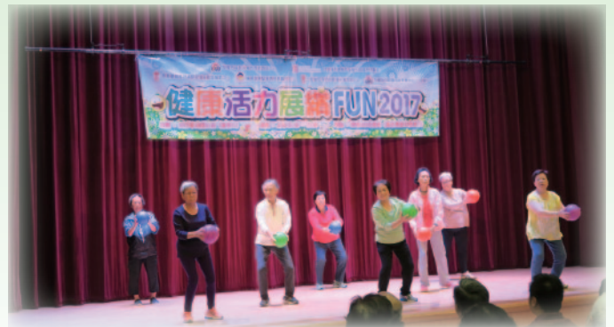
■ 中心會員於活動上表演「彈力球」，展現活力一面。

樂善堂陳黎掌嬌敬老鄰舍中心每年都積極參與地區活動，其中「健康活力展繽紛」乃為一年一度與灣仔區內多間長者服務中心合辦之聯合活動，並邀請到社會福利署東區及灣仔區策劃及統籌小組社會工作主任高志雲先生進行主禮。活動上亦有邀請到專業護士來主持健康講座；各中心分別透過不同形式，讓長者們展現「健康」及「活力」。而本中心表演的「彈力球操」，則是一種讓參加者強化肌肉，鍛煉平衡力的運動。本中心希望透過活動推介予區內長者。