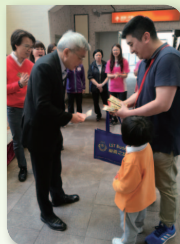
■ 家長及小朋友使出渾身解數，希望能有更多善長支持！