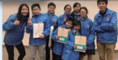
■ 樂校於綠色微電影比賽2017獲冠軍和最佳劇情獎殊榮。