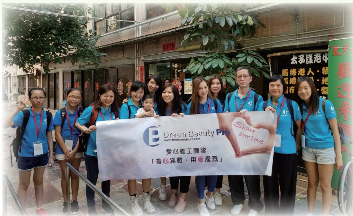
■ 義工們完成探訪後合照留念。