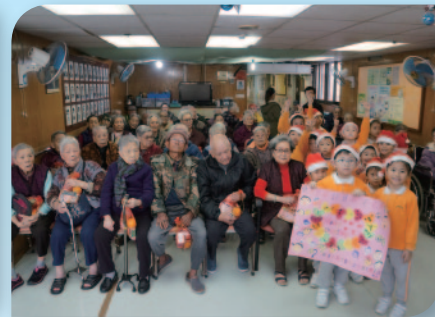
■ 學生與長者大合照。