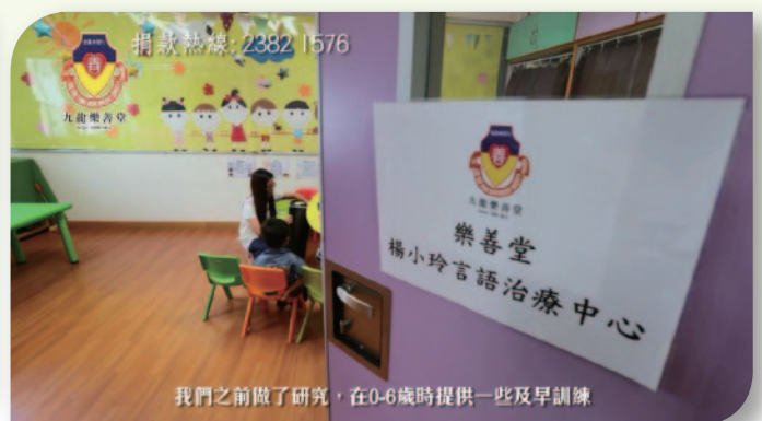
■ 「樂善同行顯情真」言語治療服務片段。

一連四集的宣傳片已於2017年12月在無綫電視翡翠台、J2及無綫財經台播出，並同步上載於本堂網站及社交平台。如欲重溫宣傳片，請掃描右邊之行動條碼(QR Code)：