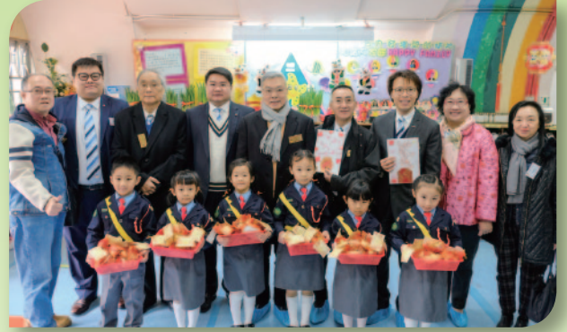
■ 總理同寅到訪樂善堂梁泳釗幼稚園。

樂善堂轄屬單位遍佈港九新界，提供醫療、教育、安老及社會福利予大眾。本堂總理同寅於2月7-8日一連兩日對各轄屬單位進行巡視，了解單位的運作及發展，務求提供更優質服務予市民大眾。