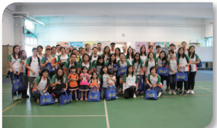
■ 多個義工團體已多年支持本堂活動，持續參與多個義工服務。