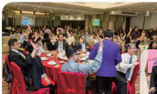
■ 幸運抽獎和問答環節 - 參加者反應熱烈。

當晚的節目豐富，晚宴開始前放映《梁書光影》片段，回顧梁書廿五年的點滴，本校校監楊小玲博士致辭感謝歷任校董、校監、校長和教職員全人多年的付出，為學校的發展奠定基礎。羅文彪校長致辭展望梁書穩步向前，邁向光輝的一頁。完成慶祝儀式後，一連串精彩的節目便展開，包括校友傾力獻唱和幸運抽獎等，整個晚上歡聲笑語不絕，場面熱鬧，充滿歡樂氣氛。