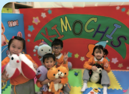
■ 角色扮演活動 — 《情緒智叻星》。

我們的課程著重兒童從「做」及「遊戲」中學習，教師會因應兒童的個別能力及需要設計合適的活動，以多樣化的遊戲及策略誘發兒童的學習動機，鼓勵兒童積極參與，從而培養出主動探索及學習的精神。當中亦會以「主題教學」及「設計活動」作互相配合，建立兒童對問題的思考、判斷和解決問題的能力，學習與人協作共事，享受學習過程獲得的樂趣。此外，我們更利用電腦及各項資訊科技作兒童的學習媒體，令他們從小體驗科技化的生活，並能在最適切的教學方法和愉快的學習環境下，建立終身學習思想，為日後成長和學習奠下良好基礎。