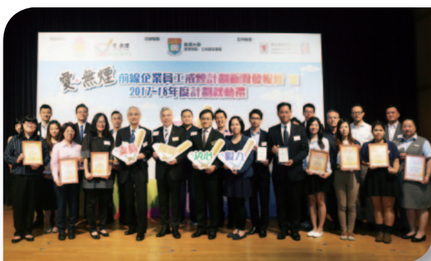
■ 企業一同支持推行無煙政策。

最後，本人特別感謝政界及商界多年來支持，並承諾樂善堂定必繼往開來，與時並進，為廣大市民提供更多適切的服務。