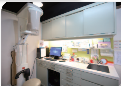
■ 樂善堂董清波銅鑼灣牙科診所及數碼全景口腔 X 光機。