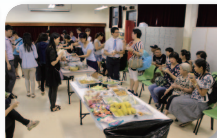
■ 家長感恩美食大會。

家校合作成功與否，實有賴校長及教職員們的主動性。經過教職員的熱誠及不斷的努力，我們已建立了家校的緊密合作關係。家長們常參與各種義務工作，協助學校運作，減輕教師工作壓力；有時家教會或個別家長更主動地為本校教職員安排美食，以示感謝，對學校來說，實在是一份強而有力的支持。