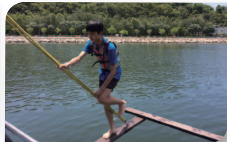
■ 暑期領袖營訓練活動，提升同學自信心。