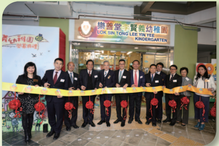
■ 主禮嘉賓楊潤雄局長、郭子宏主席及一眾嘉賓為樂善堂李賢義幼稚園開幕剪綵。

樂善堂李賢義幼稚園於2017年12月11日舉行開幕典禮，當日邀得教育局局長楊潤雄太平紳士蒞臨主禮，以及命名人李賢義先生BBS, MH、社會及教育界專業人士與本堂總理同寅一同為幼稚園進行剪綵及揭幕儀式。一群活潑可愛的同學穿上華麗奪目的衣裳，為典禮跳舞表演助慶，祝願學校「校譽日隆」。為感謝一眾嘉賓蒞臨指導，教師和同學更親手製作紀念品致謝，以遊樂場為題的畫作和盆景均寓意樂善堂李賢義幼稚園的同學能在充滿歡樂及色彩繽紛的環境下愉快學習。同時寄寓同學在教師和家長的悉心照顧下，能夠茁壯成長。儀式完畢後，全體嘉賓在容燕儀校長陪同下，參觀新校舍，不但欣賞同學的美藝作品，嘉賓更到各個課室，聆聽同學們簡介特色課題，大家更一起動手做，體驗課題的樂趣，整個典禮在一遍興高采烈的氣氛下圓滿結束。