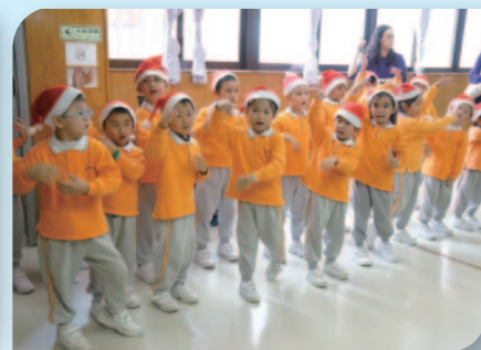
■ 學生為長者表演跳舞。