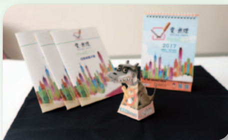
■ 宣傳用品設計及印刷。